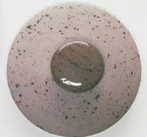
831 Grau Spenkel