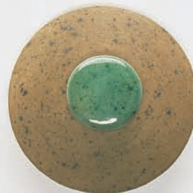
830 Grün Spenkel